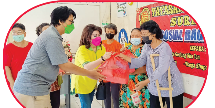
Proses pembagian paket sembako pada lansia dan warga pra sejahtera.

SURABAYA (IM) - Merayakan Cap Go Meh, Yayasan Ichlas Bhakti menggelar baksos dengan membagikan sembako ke puluhan lansia dan warga pra sejahtera, di kawasan Dinoyo Tangsi Surabaya. Pembagian baksos dilangsungkan di Balai RW 03 Kelu-