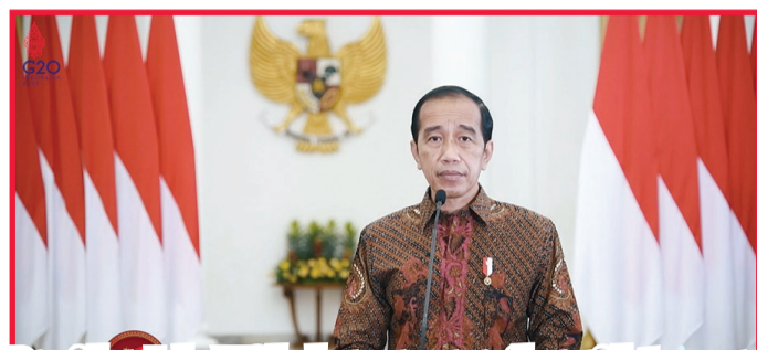
Presiden Joko Widodo menyampaikan pidato ucapan selamat Tahun Baru Imlek.