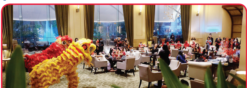
Suasana perayaan Cap Go Meh di Hotel Borobudur Jakarta yang berlangsung hangat.

Tentunya sajian ini menambahkan pengalaman khu-