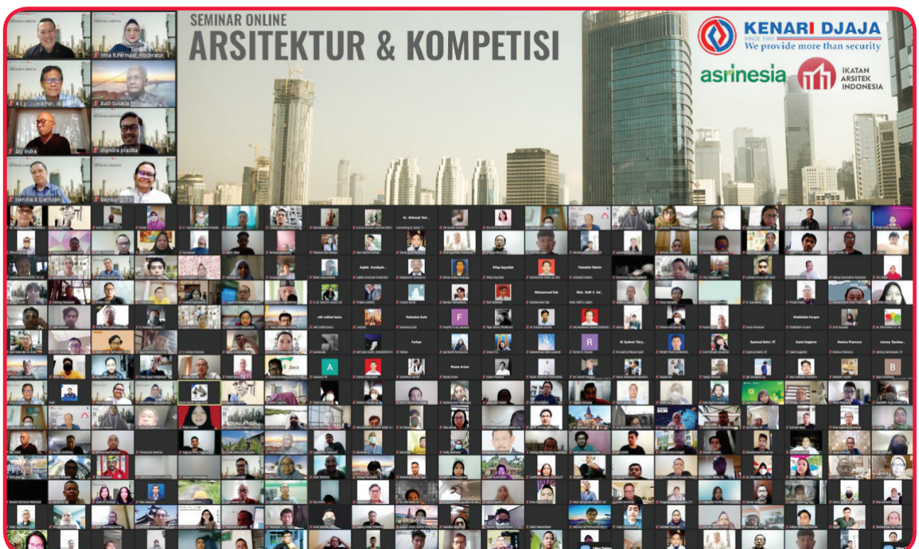
Peserta dan pembicara seminar.

Dari pengalamannya telah banyak desain arsitektur hasil kompetisi yang telah dibangun menjadi 'trend setter' pamban-