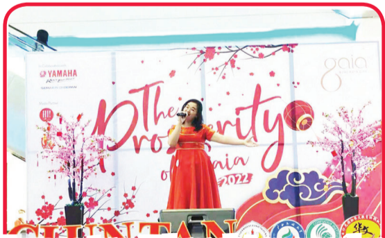
Juara pertama Kelompok A menyanyikan lagu-lagu Tionghoa.