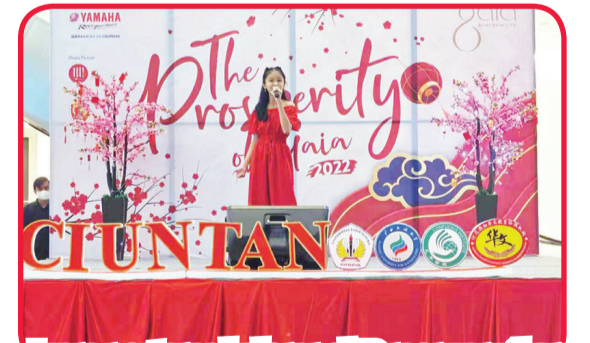
Juara pertama kelompok B menyanyikan lagu-lagu Tionghoa.