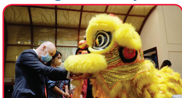
Perwakilan manajemen Hotel Borobudur Jakarta memberikan angpau ke barongsai.

JAKARTA (IM) - Perayaan Tahun Baru Imlek merupakan salah satu momen yang paling dinantikan oleh masyarakat keturunan Tionghoa. Selain Imlek yang dirayakan, Cap Go Meh menjadi acara penutup dari serangkaian perayaan tersebut. Cap Go Meh merupakan perayaan yang dilaksanakan di hari ke-15 Imlek pada penanggalan Tionghoa. Momen tersebut diartikan sebagai perayaan berakhirnya tahun baru Imlek. Perayaan Cap Go Meh di Hotel Borobudur kali ini dilaksanakan melalui rangkaian