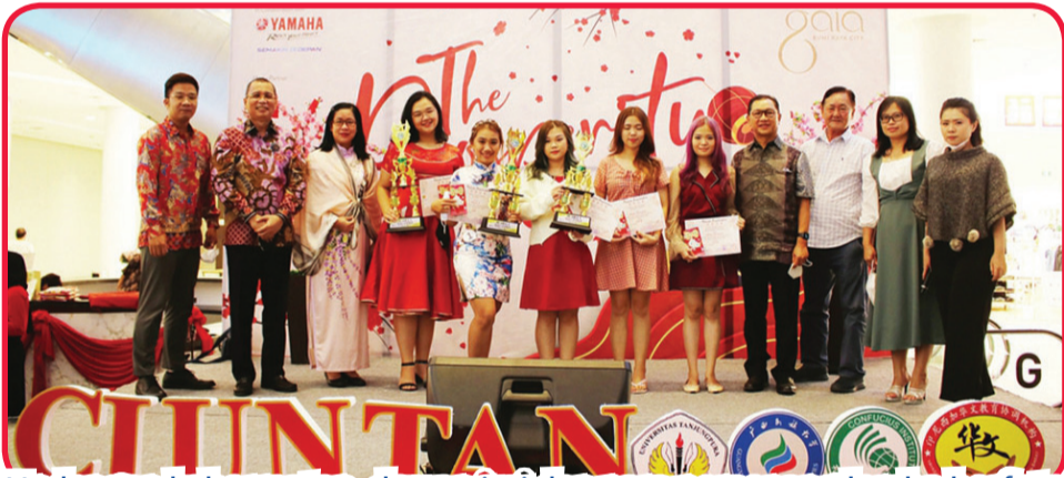
Undangan kehormatan, dewan juri dan para pemenang lomba berfoto bersama.