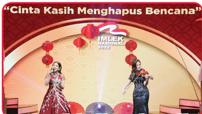
Pertunjukan seni budaya dalam puncak acara Imlek Nasional 2022.